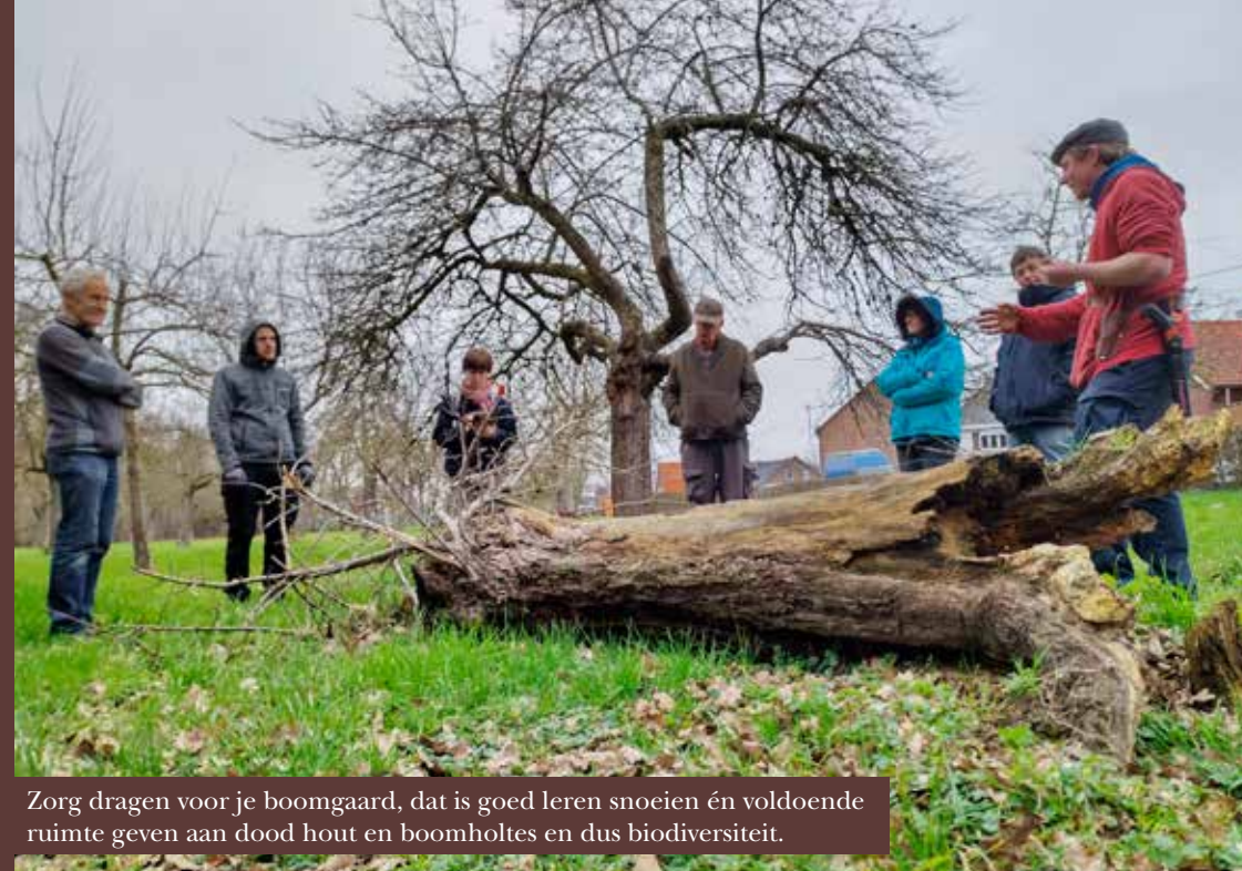
Zorg dragen voor je boomgaard, dat is goed leren snoeien én voldoende ruimte geven aan dood hout en boomholtes en dus biodiversiteit.