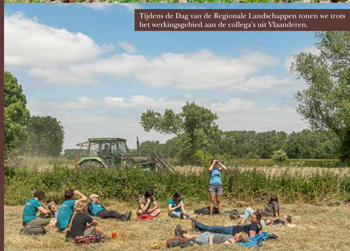
Tijdens de Dag van de Regionale Landschappen tonen we trots het werkingsgebied aan de collega's uit Vlaanderen.